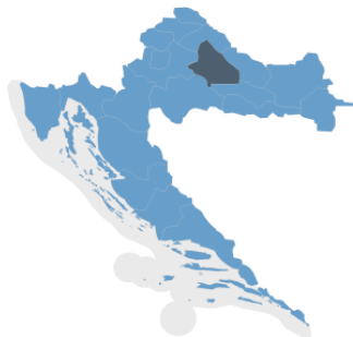
Position der Bjelovar-Bilogora Gespanschaft

Die Stadt Grubišno Polje gehört zur Gespanschaft Bjelovar-Bilogora und ist mit ihrer Fläche die größte Verwaltungseinheit der Gespanschaft. Nach der NUTS Klassifikation gehört die Gespanschaft zu der kontinentalen Region, der sogenannten grünen Region (NUTS-2).