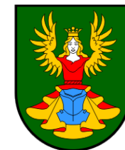
Grad Grubišno Polje