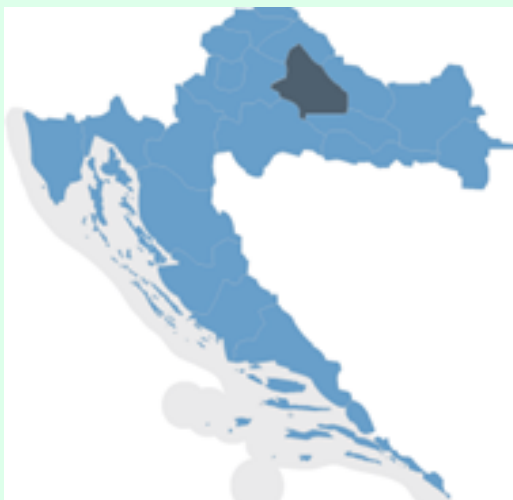
Položaj Bjelovarsko bilogorske županije

Grad Grubišno Polje pripada Bjelovarsko bilogorskoj županiji i svojom površinom je najveća jedinica lokalne samouprave. Prostire se na 269 km 2 , od čega su šumske površine 12.000 ha (45%- hrast, bukva, grab).