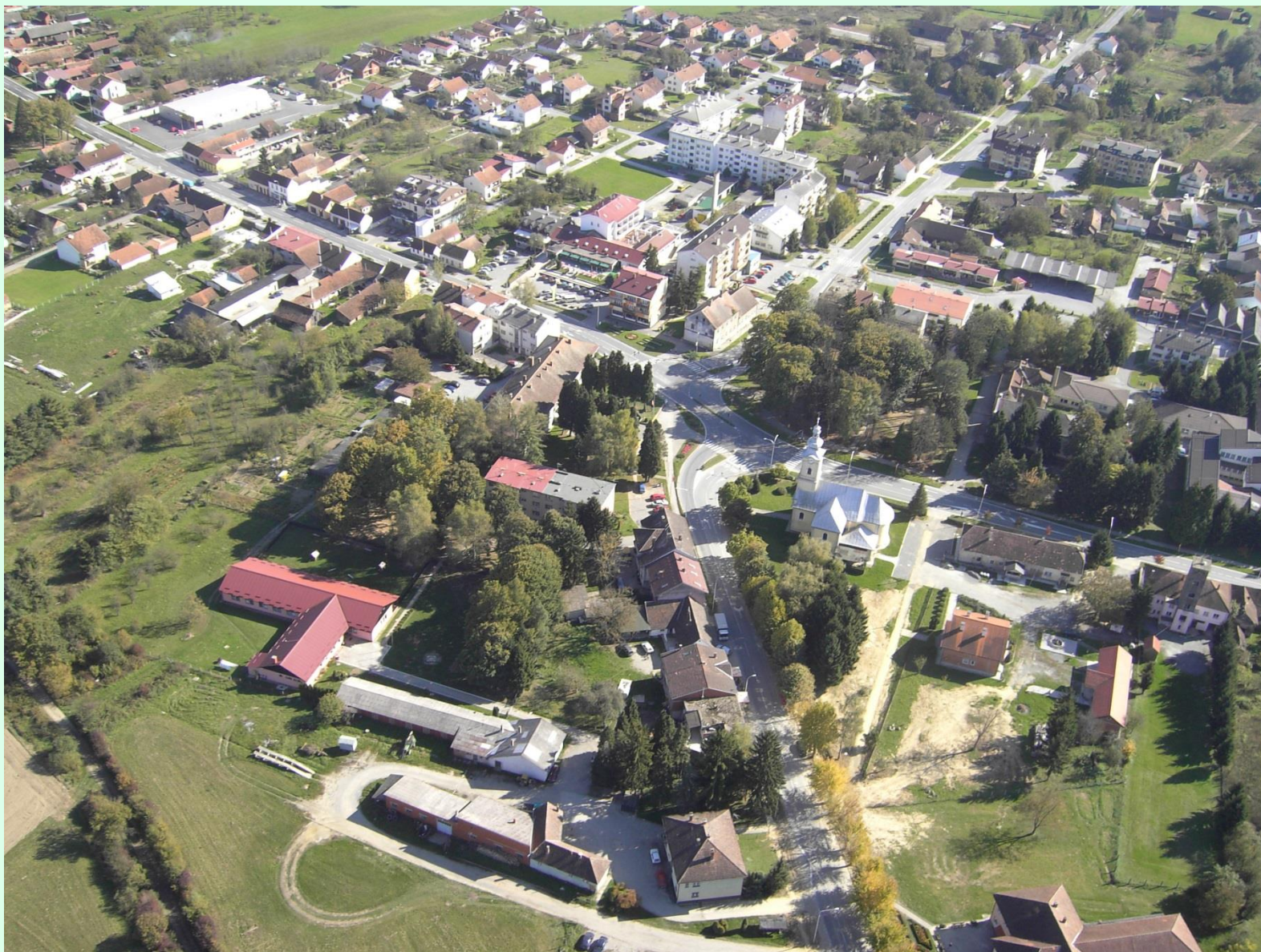
Središte Grada Grubišnoga Polja

Iskaznica Zone malog i srednjeg poduzetništva Grubišno Polje