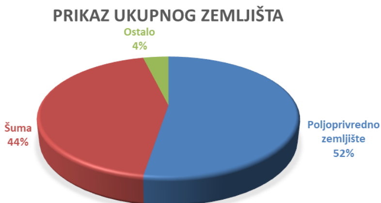
T-5 Prikaz poljoprivrednog zemljišta po načinu uporabe (kulturi):